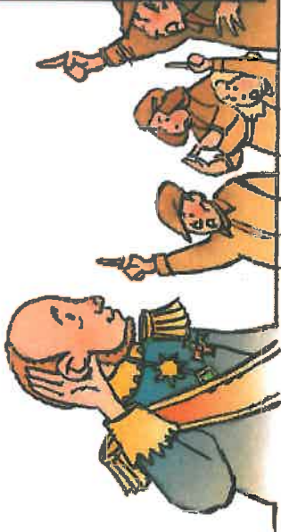
IN DE NEGENTIENDE EENW MOCHTEN ALLEEN JONGENS NAAR DE UNIVERSITEIT.